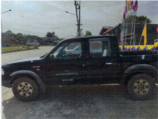
ภาพถ่ายรถยนต์ทะเบียน กข ๕๕๔๖