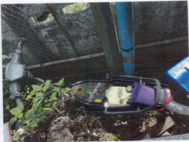
ภาพถ่ายรถยนต์จักรยานยนต์ทะเบียน ผ-๓๐๕๖