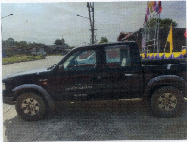
ภาพถ่ายรถยนต์ทะเบียน กข ๕๕๔๖